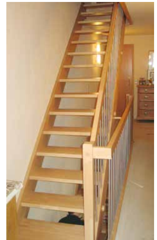
Aus Alt wird Neu